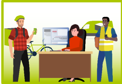
Rad putem digitalnih platformi