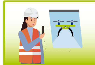
Pametni digitalni sustavi