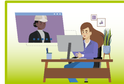
Rad na izdvojenom mjestu rada/rad na daljinu i hibridni rad