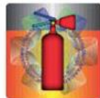
Slika 5. Izgled holograma u prirodnoj veličini