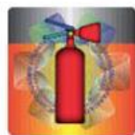
Slika 5. Izgled holograma u prirodnoj veličini