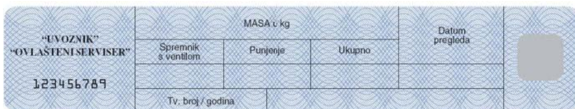
Slika 1. a